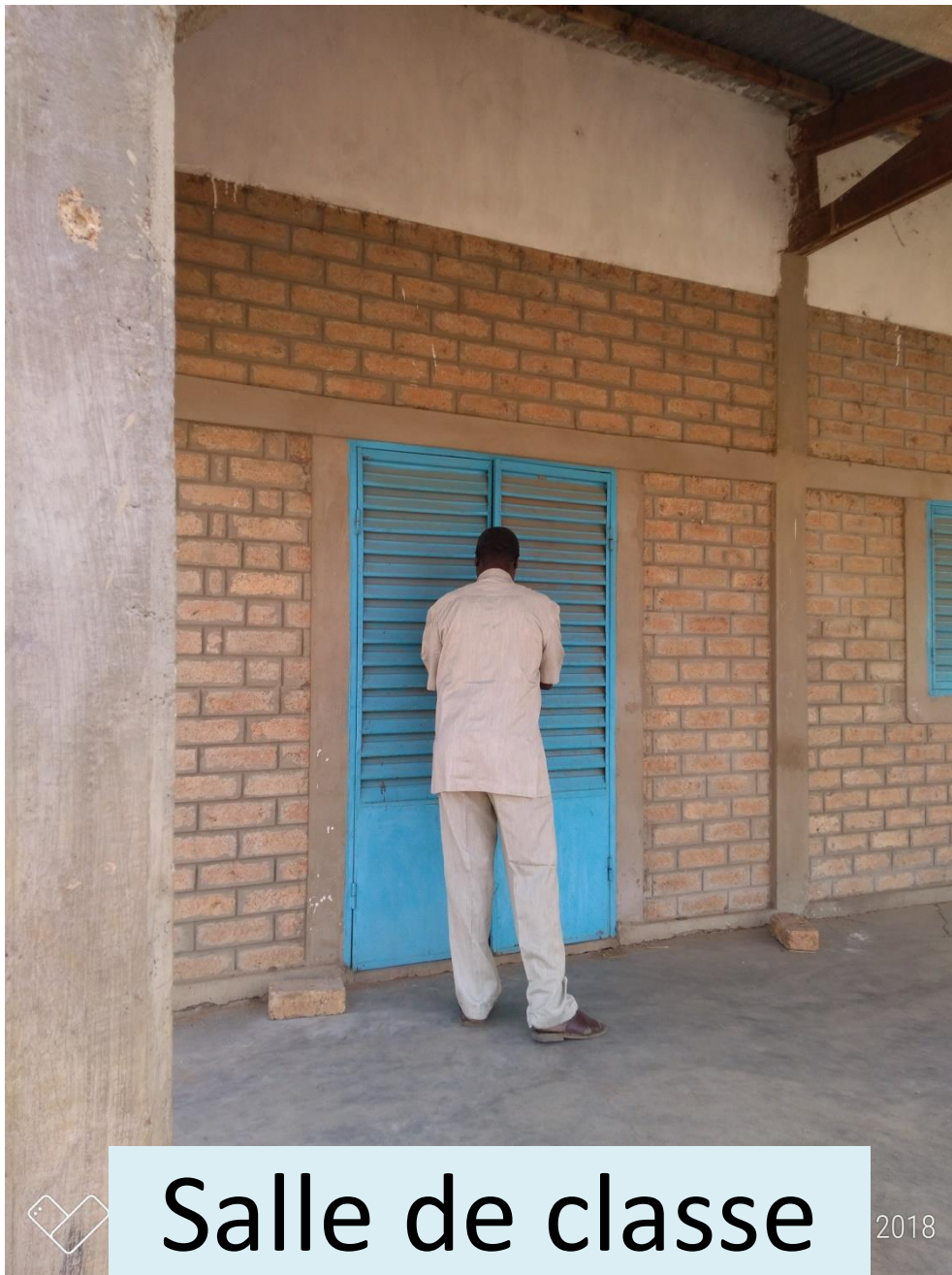
Salle de classe